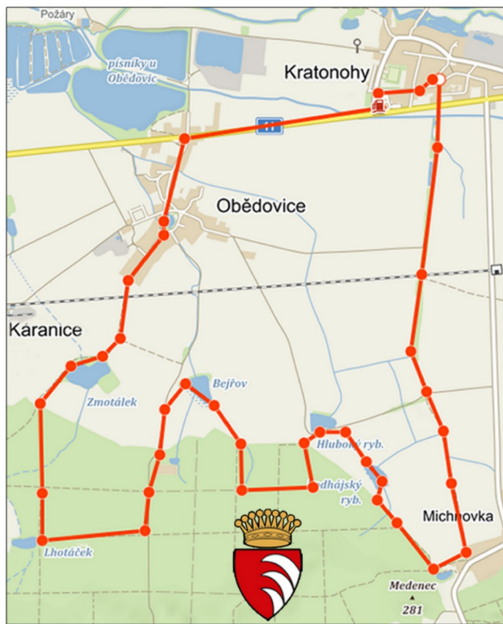
ORIENTAČNÍ TRASA POCHODU - délka cca 12km

Na konci pochodu občerstvení v Selské Jizbě.